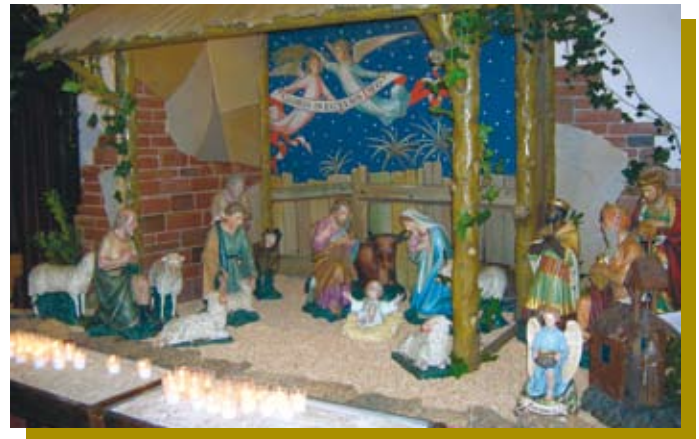
Kerststal Willibrorduskerk Diessen

Bij de vieringen mag het dan geldende aantal personen aanwezig zijn. Aanmelden voor maximaal één viering tijdens de kerstdagen kan bij het parochiesecretariaat: (013) 504 1215 of info@h-norbertus.nl. Alle vieringen vanuit Hilvarenbeek zijn te volgen via Beek TV of www.hilverportal.nl ■