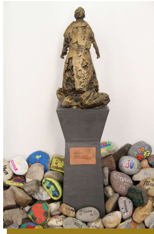
Petrus op de steenrots, Sint Petruskerk

Uw deelname aan de Actie Kerkbalans doet er toe. Geef vandaag voor de kerk van morgen!