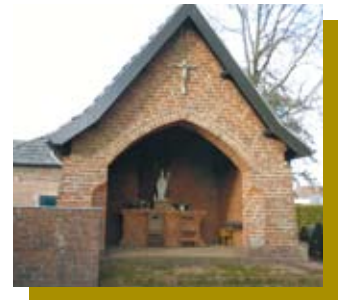
H. Corneliuskapel - Esbeek

De kerk heeft voor iedereen een eigen betekenis. Het is de plek waar u viert en rouwt, waar u rust zoekt of tot bezinning komt of waar u een kaarsje aan kunt steken als u daar behoefte aan heeft. Alles van waarde vergt onderhoud. Voor het verzorgen van de erediensdiensten, de verwarming, de verlichting, het geluid, de gebouwen, enzovoorts is geld nodig.