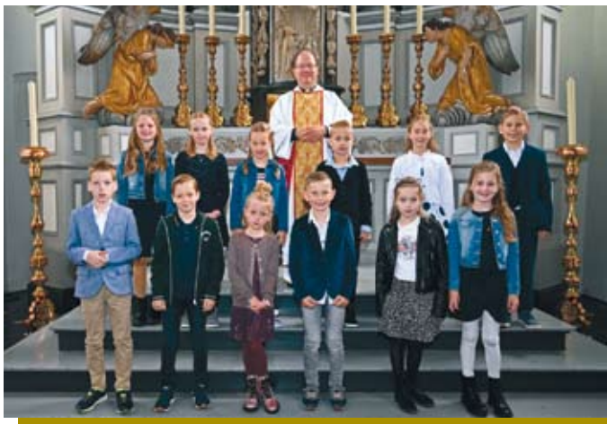
De Communicanten uit Diessen 2020

Afgelopen jaar was een apart jaar met de coronacrisis en de vele beperkende maatregelen. Toch hebben we de Eerste Communievieringen wat later in het jaar door kunnen laten gaan. Wat vele mensen fijn vonden, is dat in de coronatijd de vieringen via YouTube en Beek TV gevolgd konden worden.