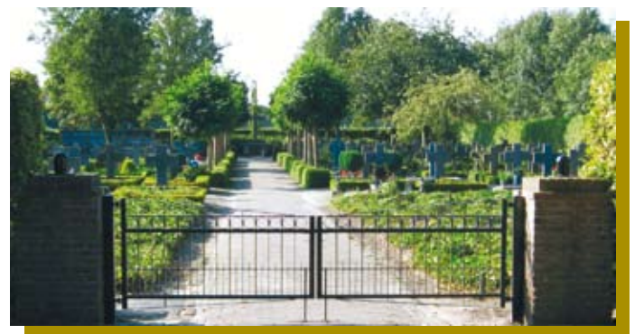
Begraafplaats - Haghorst