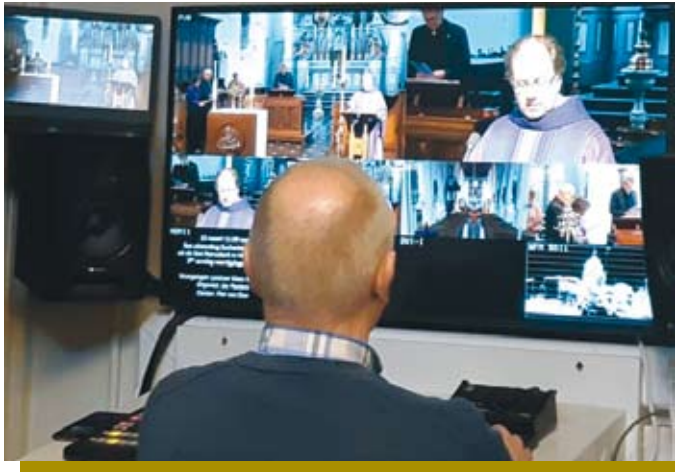
Een kijkje achter de schermen van Beek TV tijdens de vieringen

Het is tijd voor Actie Kerkbalans die dit jaar plaats vindt van 7 tot 25 januari. Als kerk willen we er zijn in vreugde en verdriet en alle andere belangrijke momenten in het leven. Om als kerk de nabijheid van Gods liefde gestalte te kunnen geven en mooie liturgische gezongen vieringen te verzorgen, doen we een beroep op uw vrijwillige bijdrage voor onze Norbertusparochie.