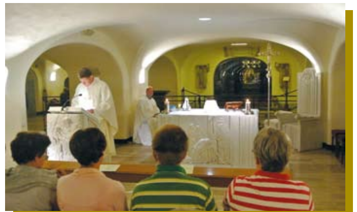
H. Mis in de crypte bij het graf van St. Petrus

Voor een uitgebreid verslag van de reis wordt verwezen naar de site van reisorganisatie VNB: www.vnb.nl . ■