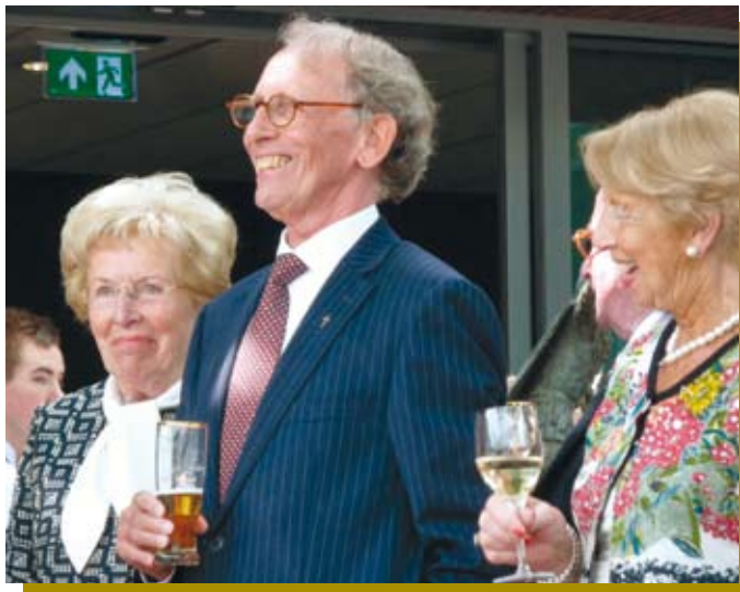
En de jubilaris... hij genoot ervan!

Vele kerkgangers staken het Vrijthof over om in MC Elckerlyc de jubilerende priester hartelijk de hand te drukken en een praatje te maken. Harmonie Concordia van 1839 gaf een fraaie serenade, waarin het lied "De Bikse hermenie" (tekst van Cees zelf) niet ontbrak. Ook in Elckerlyc was er een ontspannen en feestelijke sfeer.